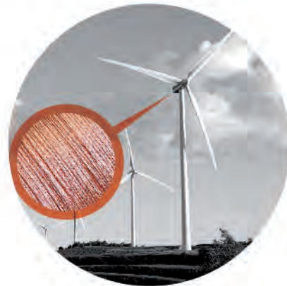
Alambrón Wire rod

Mercado: Tubos de cobre Market: Copper pipes