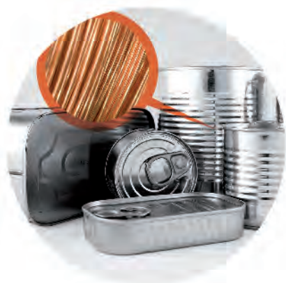
Hilo de soldadura Can welding wire

Mercado: Fabricantes de productos de extrusión Market: Extrusion products manufacturers