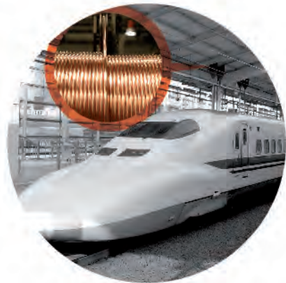
Hilo de contacto ranurado Overhead contact wire

Cables rígidos para tendido aéreo Rigid cables for railway electrification Cables flexibles para tendido aéreo Flexible cables for railway electrification Aleaciones (CuAg, CuSn, CuMg) Alloys (CuAg, CuSn, CuMg) Mercado: Electrificación ferroviaria Market: Railway electrification