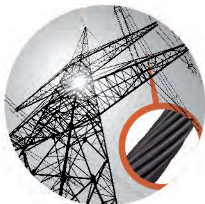
CAC (Copper Alloy Conductor)

Our research centres work with universities and technology centres to develop new applications and materials.