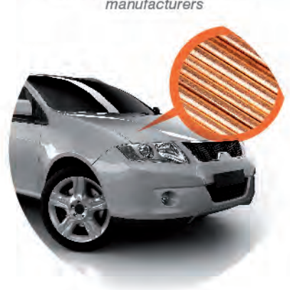
Alambrón Wire rod

Mercado: Fabricantes de conductores eléctricos Market: Electrical conductors manufacturers