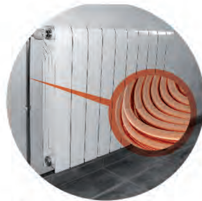
Tubos para agua, calefacción, gases y energía solar térmica Pipes for water, heating, gas and thermal energy

Mercado: Cables aéreos para baja, media y alta tensión Market: low, medium and high voltage overhead cables