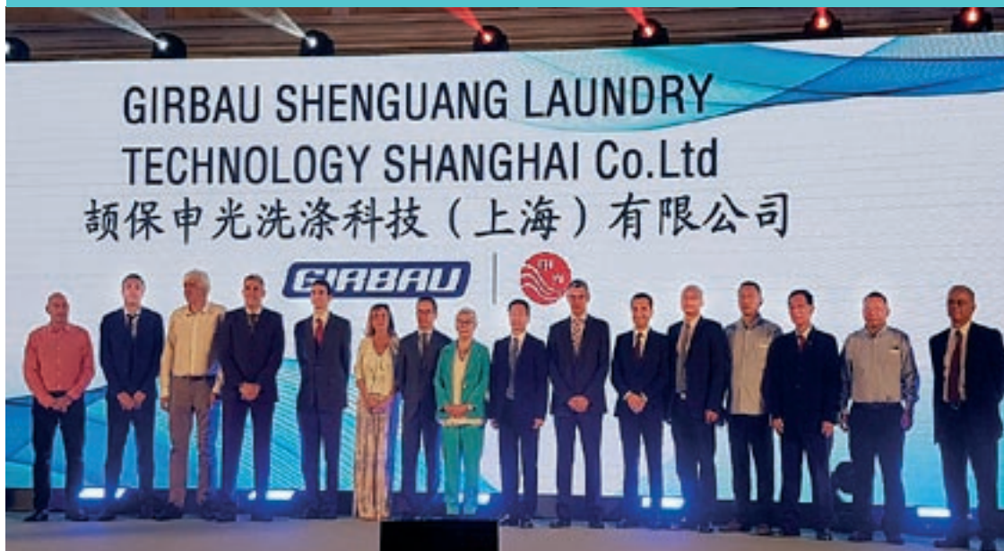
Girbau va comprar l'any 2017 una fàbrica a la Xina on ja fabrica amb un 'partner' del país

Tot i alguna excepció, una cinquantena d'empreses de diversos sectors van recuperar o superar xifres de l'any 2007